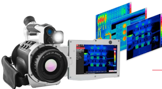
Einfache Datenübernahme via IRBIS® 3 report